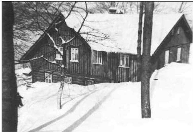
Abb. 59: Das FISCHER-Haus (Nr. 21) im oberen Dorf nahe der Schule. – Foto um 1940.

Pavel Hlaváč, Rentner (evangelischer Pfarrer)